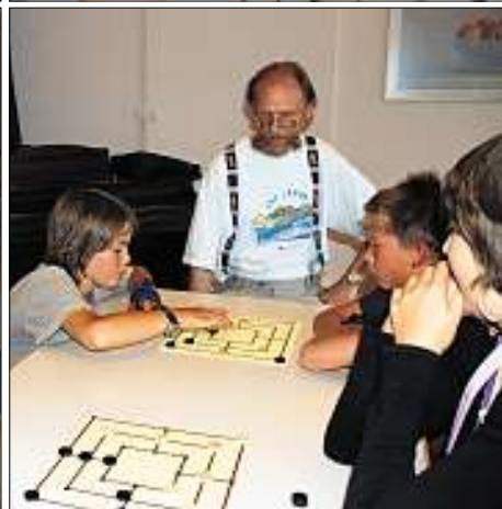
Mit grösster Konzentration beim Spiel: Die Ferienpass-Kinder lernen im Alterszentrum Guggerbach in Davos die wichtigsten Mühle-Züge.

ist wie bei anderen Sportarten: Man muss hart trainieren und auch die geistige Kondition mibringen, denn ein Turnier dauert manchmal sechs oder noch mehr Stunden. Nur wer am Schluss in einem Finalspiel mental frischer ist, hat die Chance zu gewinnen.