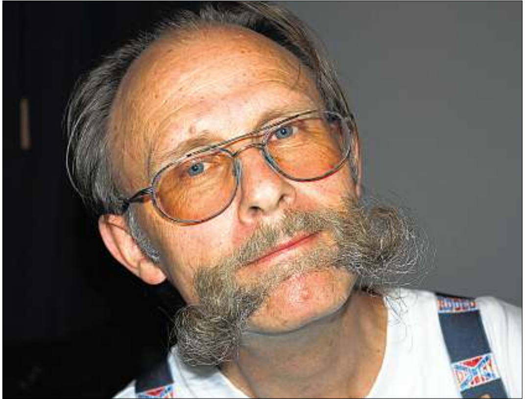
Ein Strategie der Extraklasse: Markus Schaub ist der beste Mühlespieler der Welt.